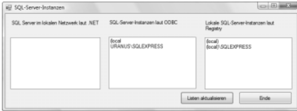
Abbildung 25.3: SQL-Server-Instanzen

Nach meinen Erfahrungen gibt es momentan keine Methode, um SQL-Server-Instanzen im Netzwerk auch nur einigermaßen zuverlässig aufzuspüren. RegistryInstances findet die lokalen Instanzen sehr schnell, gibt aber keine Informationen darüber, welche der lokalen Instanzen tatsächlich läuft! (Insofern ist das Ergebnis von RegistryInstances nicht besonders praxistauglich: Es ist nicht möglich, eine Datenbankverbindung zu einer zwar installierten, aber nicht gestarteten Instanz herzustellen.)