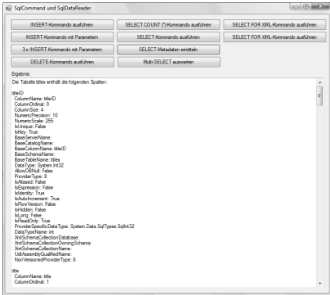
Abbildung 25.5: Metadaten zur Abfrage SELECT * FROM titles

' Beispiel ADO.NET-classes\command-intro\Forn1.vb