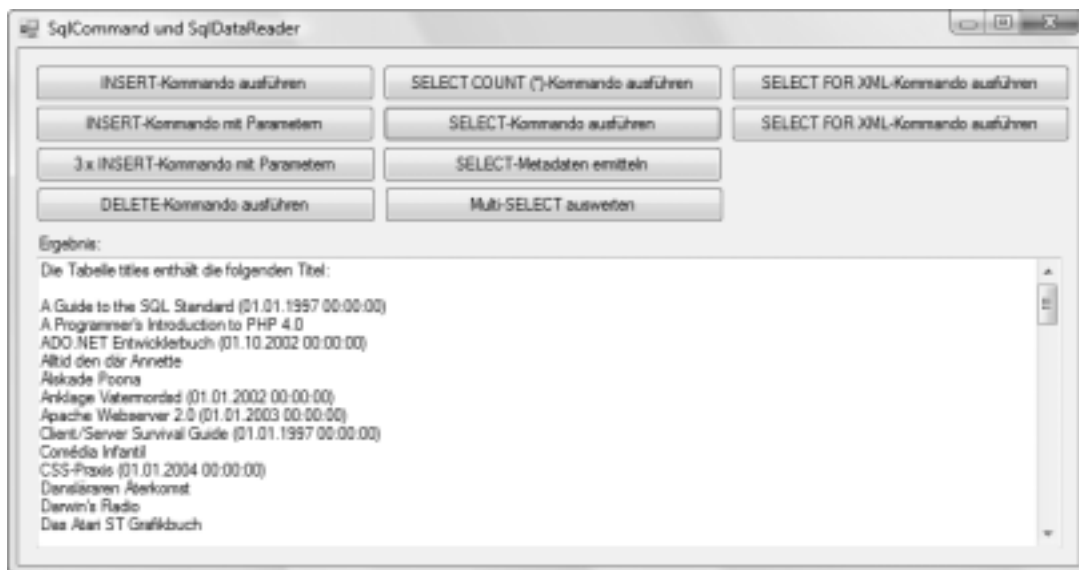
Abbildung 25.4: SqlCommand-Varianten ausprobieren

Das Beispielprogramm command-intro illustriert die verschiedenen Verfahren und zeigt die Ergebnisse in einer Textbox an (siehe Abbildung 25.4). Durch den DELETE -Button werden übrigens nur jene Bücher aus der titles -Tabelle gelöscht, deren Titel mit test beginnt.